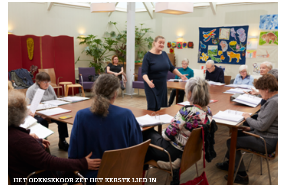
HET ODENSEKOOR ZET HET EERSTE LIED IN